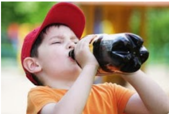
A. Beber bebida

6. ¿QUÉ NECESITABA BEBER EL PEQUEÑO? (2 PTOS)