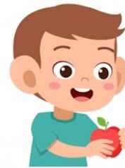
C. Comer una manzana

7. OBSERVA LAS IMÁGENES E INDICA QUE OBJETO COMIENZA CON LA VOCAL A. (2 PTOS)