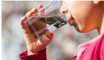
B. Beber agua