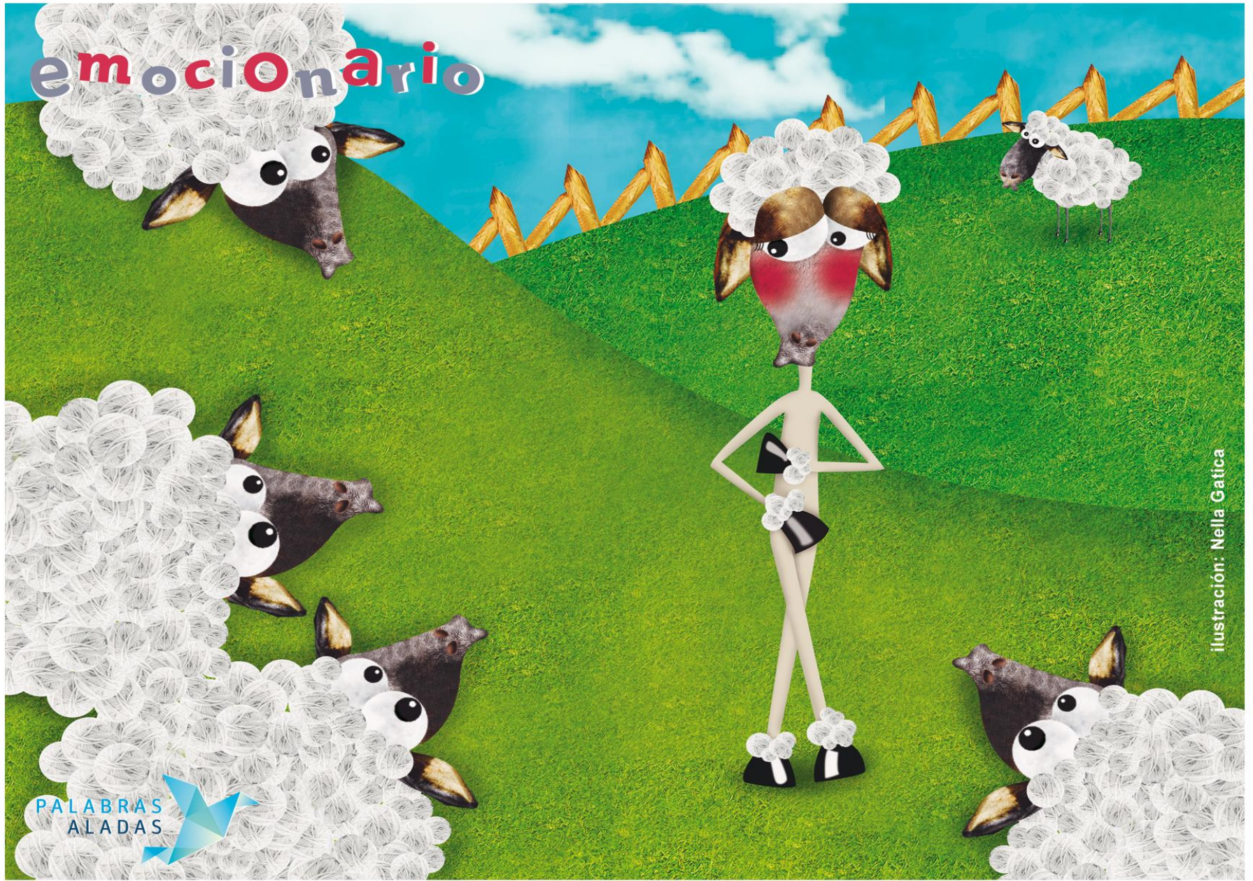
ilustración: Nella Gatica