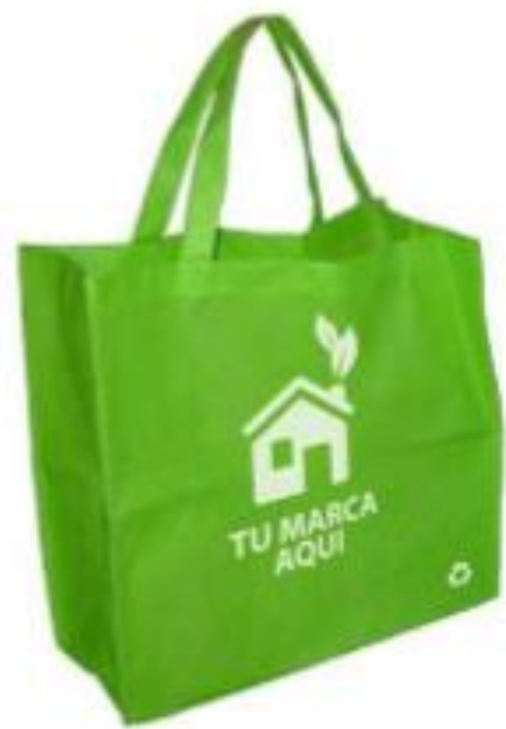
Utilización de bolsas reutilizables

1. Observa las imágenes que constituyen soluciones para reducir el exceso de basura en el planeta