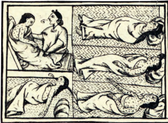
A Ilustración que representa la epidemia de viruela en la población indígena. En Sahagún, Bernardino de (Siglo XVI). Historia general de las cosas de Nueva España .

OBSERVA LA IMAGEN Y RESPONDE LAS PREGUNTAS 12 y 13