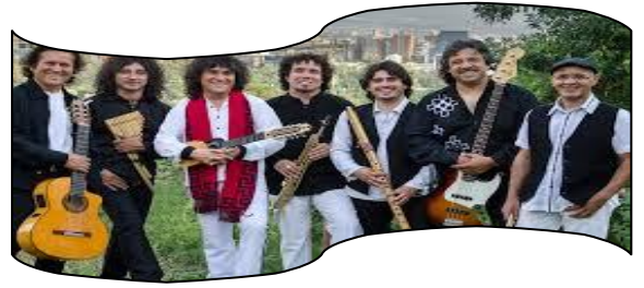
Mezcla de estilos

Alumnos y alumnas!!! Ustedes sabrán que muchos grupos chilenos entre ellos Illapu han difundido el patrimonio musical del país y del continente . En el cual su trabajo es una fusión popular con raíces folclóricas e indígenas.