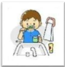
Lavado de dientes