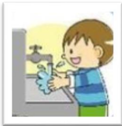
Lavado de manos

En relación a la actividad realizada en la guía de matemática, a continuación te presentaré diferentes actividades de la vida diaria y deberás realizar una breve descripción de esta actividad y su importancia para tu bienestar.