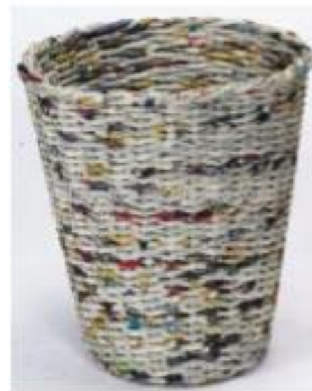
Reutilización del papel