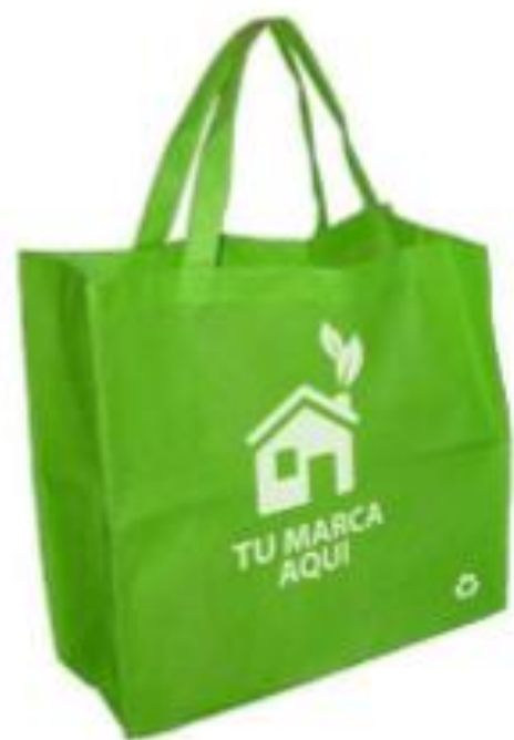
Utilización de bolsas reutilizables

1. Observa las imágenes que constituyen soluciones para reducir el exceso de basura en el planeta