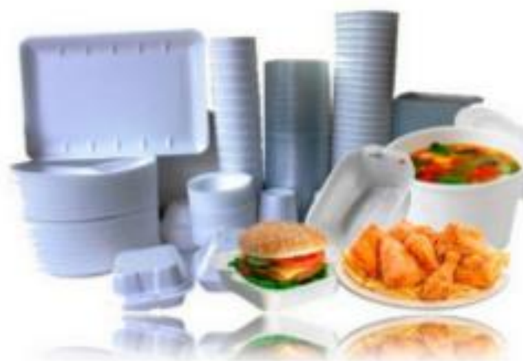
Eliminación de los envases desechables