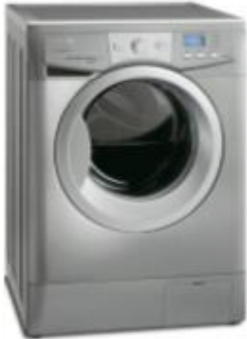
Lavadora de ropa

1.- Escoge uno de los siguientes objetos tecnológicos y completa la actividad dos