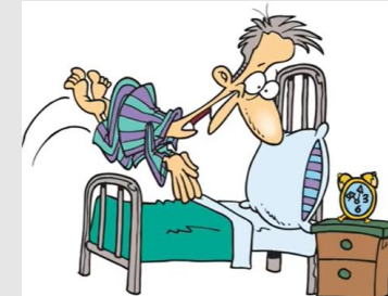
I go to bed