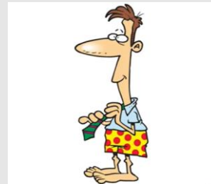
I get dressed