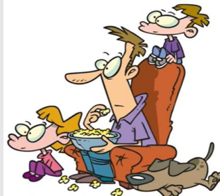
I watch TV