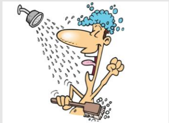
I take a shower