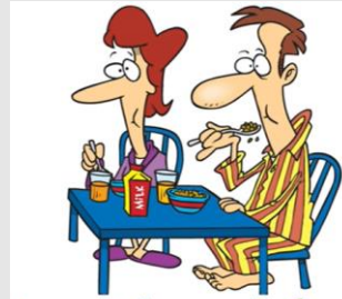
I eat breakfast