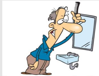
I comb my hair

En nuestra vida, siempre hay acciones que van a depender del tiempo. Ya sea la hora, el día o el mes, o la fecha, hay ciertas acciones que se van a repetir. Aquellas cosas que realizamos día a día son las rutinas.