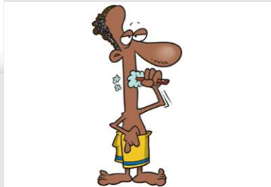
I brush my teeth