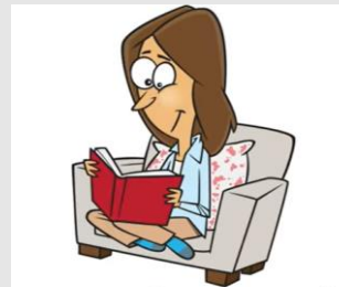
I read a book