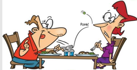
I eat dinner