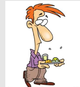
I eat lunch