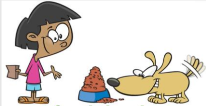
I feed the dog