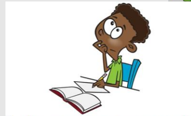
I do my homework