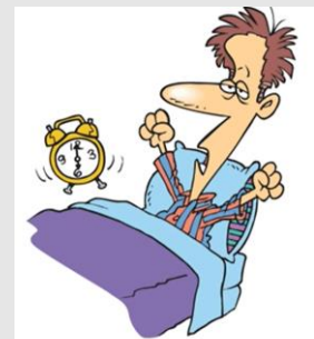
I wake up