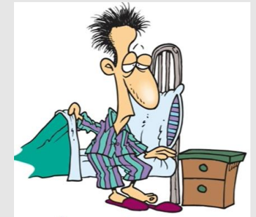
I get up