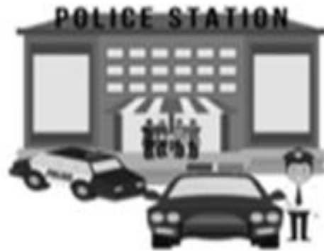
THE POLICE STATION

THE RESTAURANT IS NEXT TO THE POLICE STATION