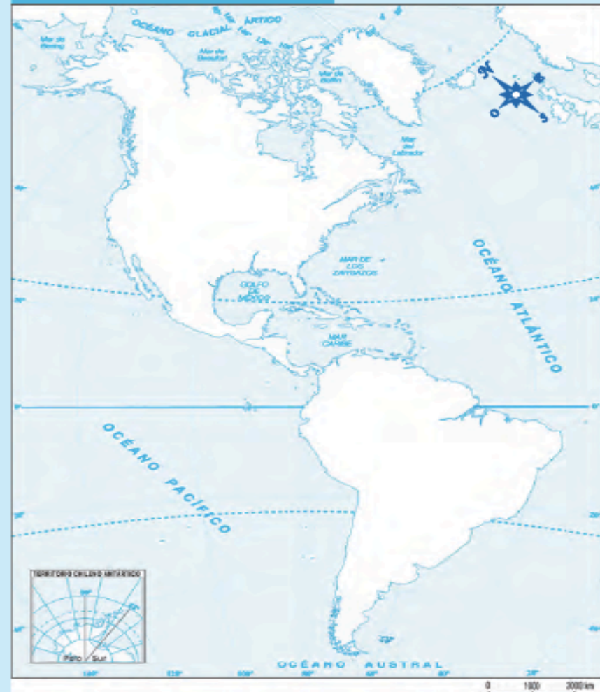
Mapa de América

4. Según tus conocimientos, ¿qué tienen en común México y gran parte de los países de Centroamérica? Señala, por ejemplo,