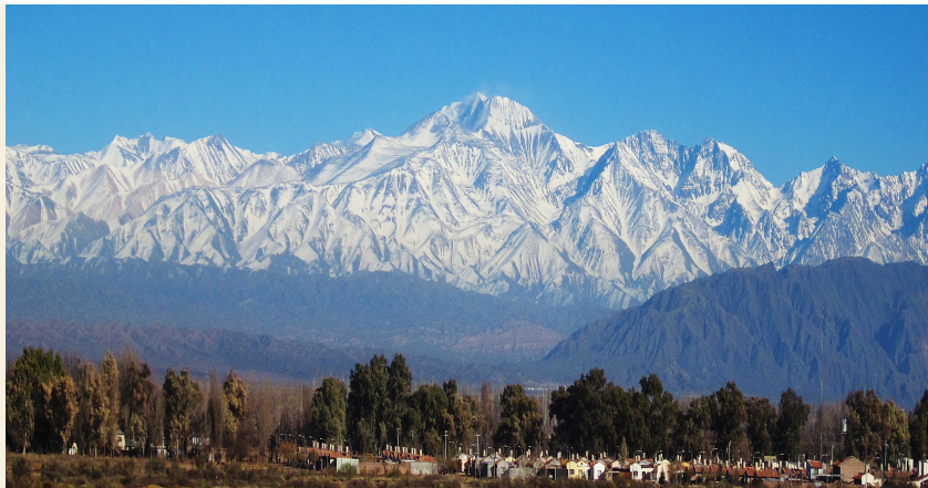
Cordillera de los Andes