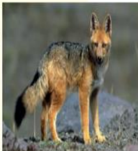
▲ Zorro culpeo en la cordillera de los Andes.

ñirre: arbusto que crece en la Patagonia.