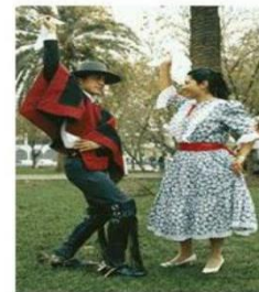
Trajes Zona Central