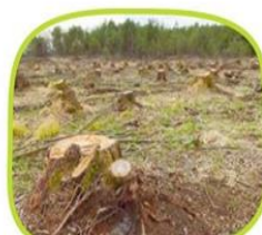
Tala indiscriminada (se cortan más árboles de los que se plantan.

Las plantas son muy importantes para nuestro planeta y para quienes habitamos en él. Lamentablemente hay actividades que realiza el ser humano que pueden perjudicar la supervivencia de las plantas y, con ello, la de los demás seres vivos, entre esas acciones están: