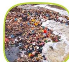
Contaminación de suelo y agua.

2.-Observa la siguiente imagen y responde las preguntas: Responde en tu cuaderno de Ciencias Naturales.