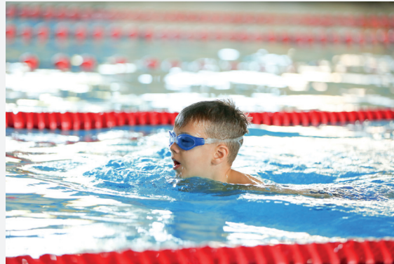
▲ Niño en clases de natación.