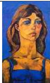
Carolina de Mónaco